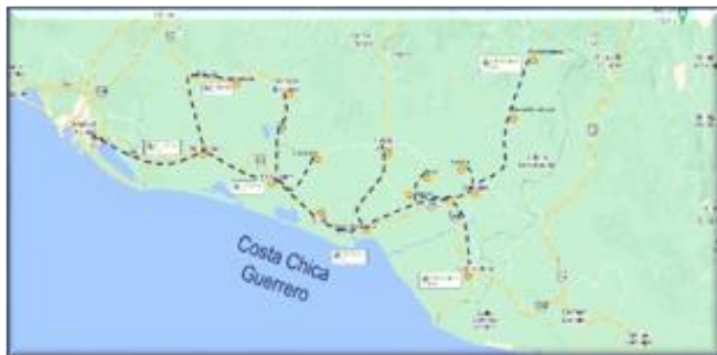
Figura 2. Circuitos turísticos en Costa Chica Guerrero

15.- Tecoanapa. Coordenada (16.98607904270179,-99.26039037514707) Los recursos turísticos culturales son: Estatua del general Ignacio Allende, Parroquia de la Virgen del Rosario. Los recursos naturales son: una laguna y un río, barra de Tecoanapa. Cade destacar que actualmente se han agregado otros tres municipios, el caso de las Vigas, San Nicolás y Ñuu Savi.