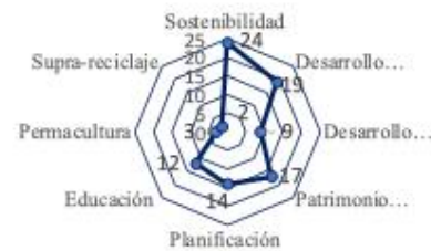
Figura 4. Estrategia de economía social – circular