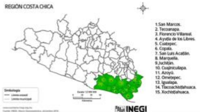
Figura 1. Mapa costa chica del estado de Guerrero.

El cultivo de mango es de gran importancia socioeconómica, para la Costa Chica y los principales cultivares de exportación son: Tommy Atkins, Haden, Kent, Keitt y Ataúlfo, debido a sus características particulares como sabor, aroma y tamaño (Vargas et al., 2016). Las regiones de mayor producción y superficie sembrada en el estado son: la Costa Grande y Costa Chica, donde el cultivar predominante es el Manila con 33% de la superficie, seguida por Ataúlfo, Haden, Criollos y Tommy Atkins, con el 30.3, 16.0, 14.5 y 4.9% respectivamente (SIAP, 2014). Reconocer que en estas comunidades se cuenta con capacidad productiva, es un buen indicador para apoyar al sector turístico desde otra perspectiva.